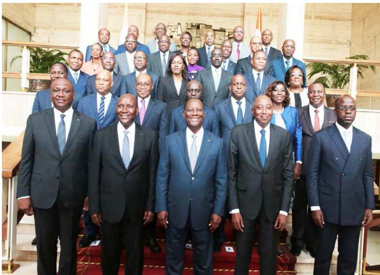
Le Gouvernement du Premier Ministre Amadou Gon Coulibaly veut améliorer le cadre de vie des Ivoiriens.

Désormais Ministre de la Salubrité, de l'Environnement et du Développement Durable, Anne Désirée Ouloto a échangé le vendredi 3 février 2017 avec le Corps diplomatique accrédité, les partenaires et les personnels du ministère sur les différentes orientations pour améliorer le cadre de vie des populations ivoiriennes. Discours programme, discours d'orientation. Lisez !