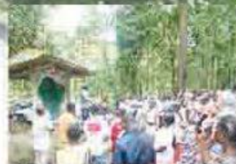
Visite au coeur du Parc national du Bancé