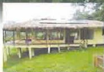
L'écotel au Parc national de Taï