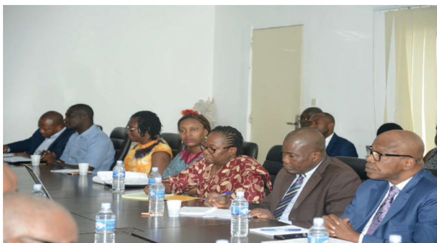
les parties prenantes ont apporté leurs contributions pour la bonne organisation de la COP 25

Il faut relever que les préparatifs ont très tôt débuté cette année comparement à l'année dernière.