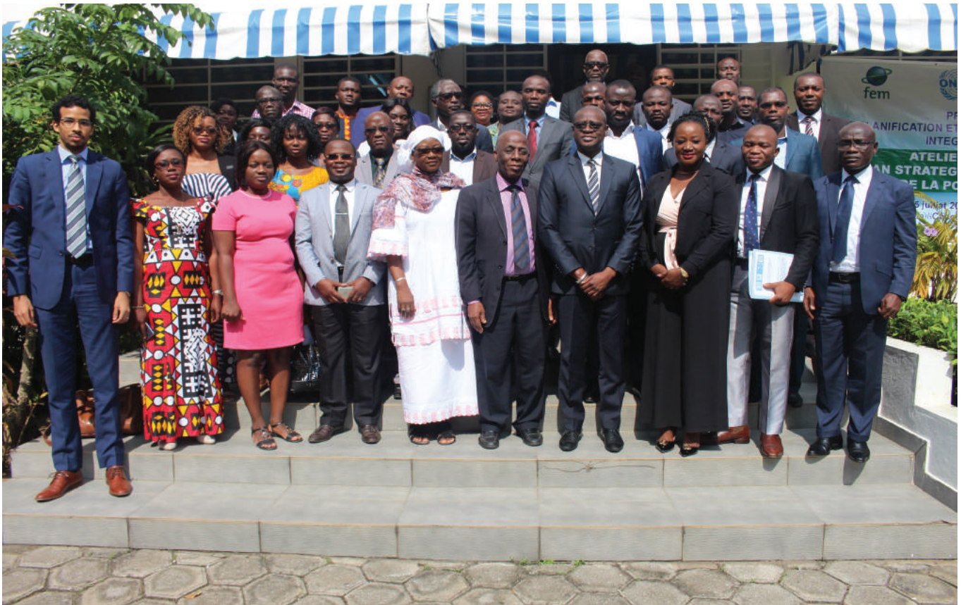
photo de famille des participants